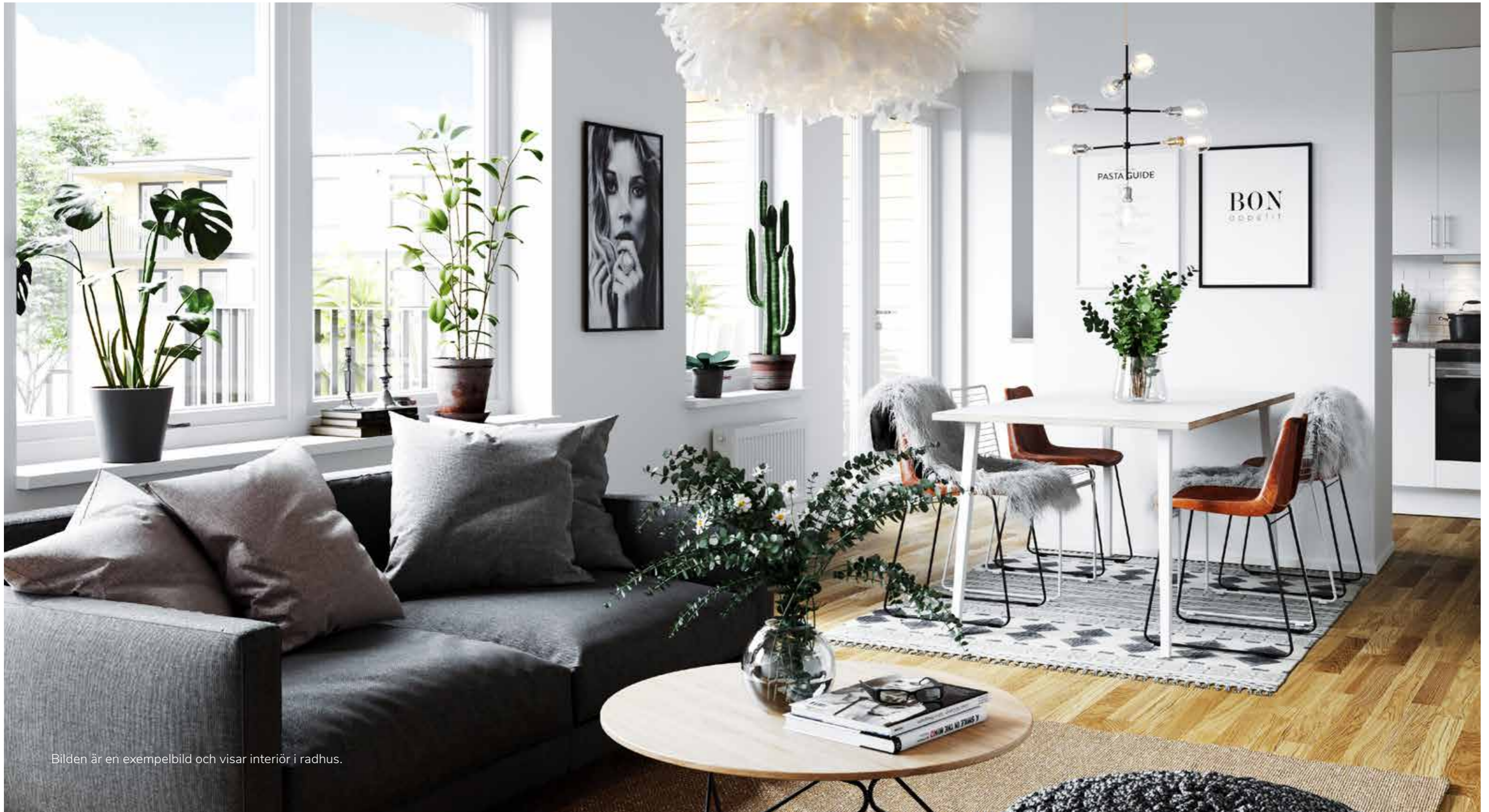
Bilden är en exempelbild och visar interiör i radhus.

Vi gillar inredning som är snygg och håller länge. Därför väljer vi högklassiga, tidlösa och gedigna material som förhöjer din vardag. Samtliga bostadsrum får slitstarka och vackra golv av ekparkett. I hallen lägger vi lättskötta klinker. Badrummen är helkaklade och har komfortgolvvärm. Alla vitvaror kommer från välkända kvalitets-tillverkare. Lägenhetens självklara mittpunkt blir ett modernt och slitstarkt kök. I den höga standarden ingår också rymliga garderober och egen tvättmaskin och torktumlare i badrummet.