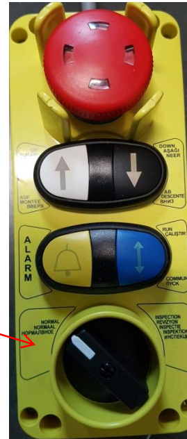
Manöverhandtag i hissgröp.